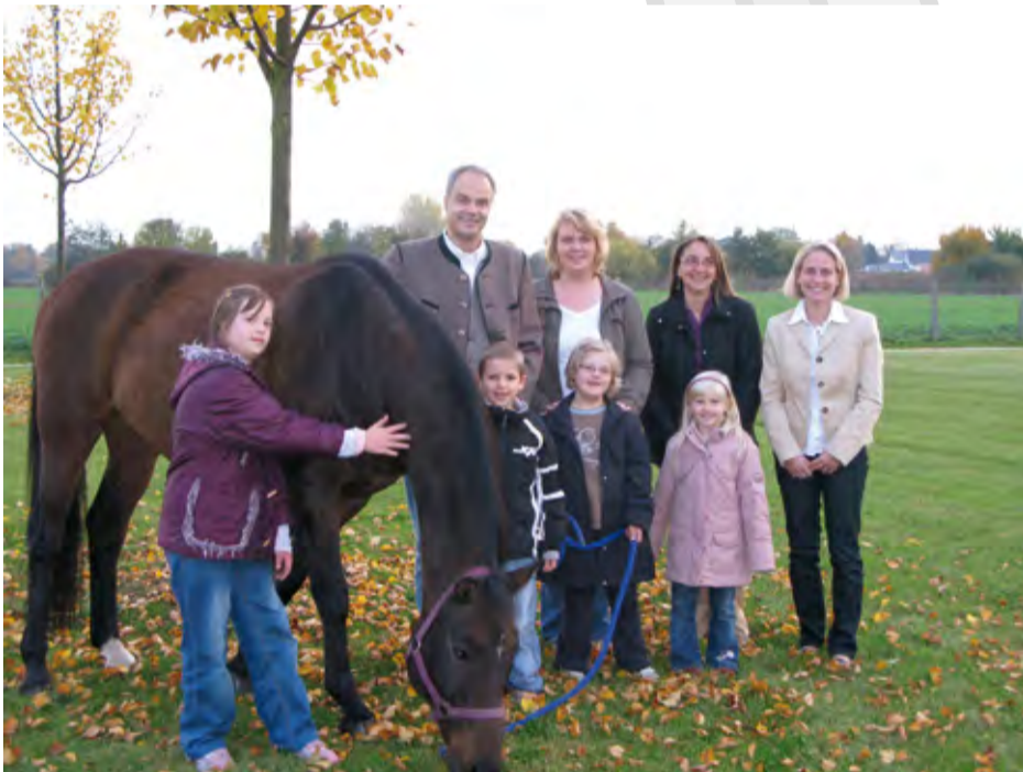
Vandango bringt nichts aus der Ruhe.

Richtig helfen ist ganz leicht: Mehr Informationen rund um ELISA und seine Projekte finden Sie im Internet: www.elisa-familiennachsorge.de www.lebenshilfe-Ingolstadt.de