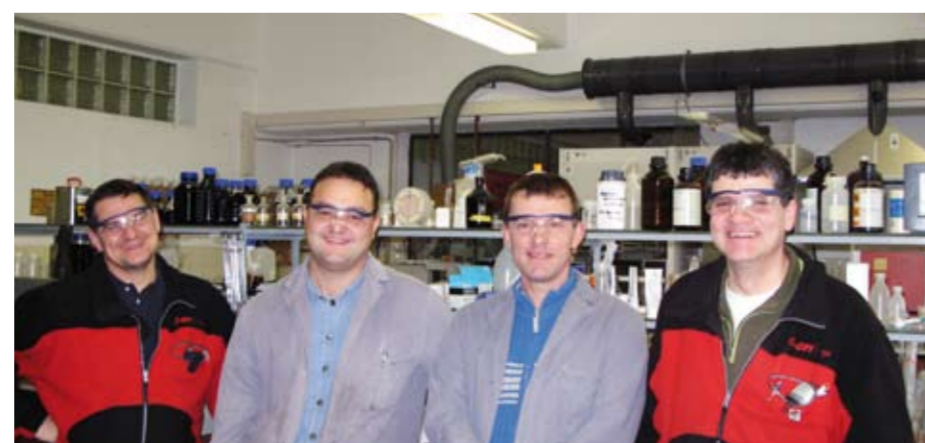
Alles im Griff: Das Laborteam aus Ingolstadt untersucht alle elektrochemischen Prozesse im Kraftwerk.

Was für unser Rauchgas gilt, hat natürlich auch bei Kühlwasser, Speisewasser und sonstigem Prozesswasser Gültigkeit. Das heißt, das Wasser, das wir im Kraftwerk verwenden, wird von uns anschließend wieder gereinigt, gefiltert und schließlich zurück in die Donau geleitet. Alle Untersuchungsergebnisse werden von uns dokumentiert und regelmäßig von den zuständigen Behörden überprüft.