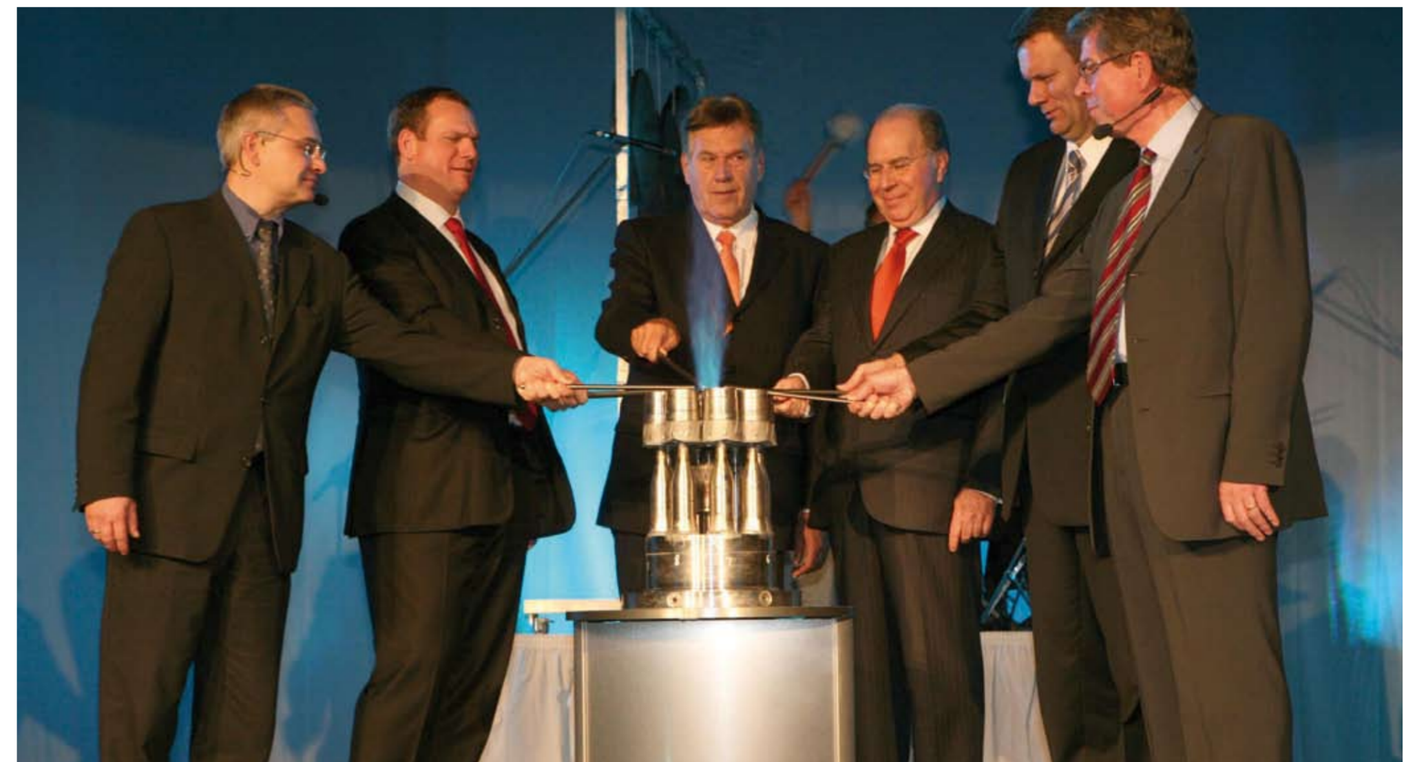
Zündend: Der Ehrengast, Bundeswirtschaftsminister Michael Glos, entzündete gemeinsam mit Vertretern von Siemens und E.ON symbolisch das erste Feuer.